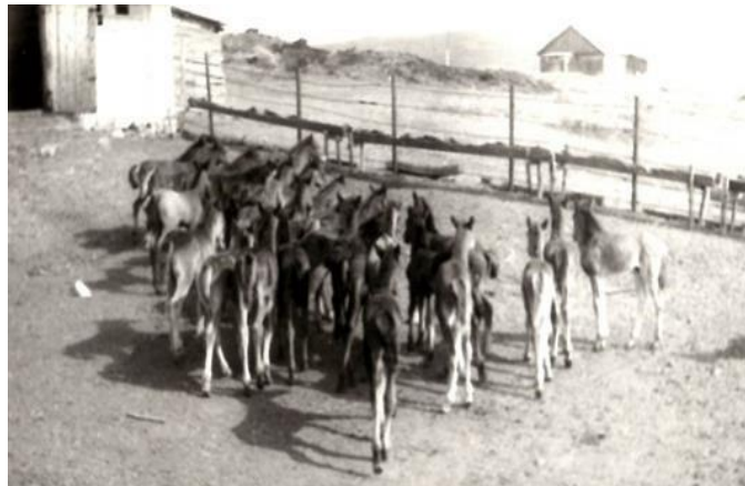
Eine Aufnahme von dem Pferdestall, im ehemaligen Kuhstall