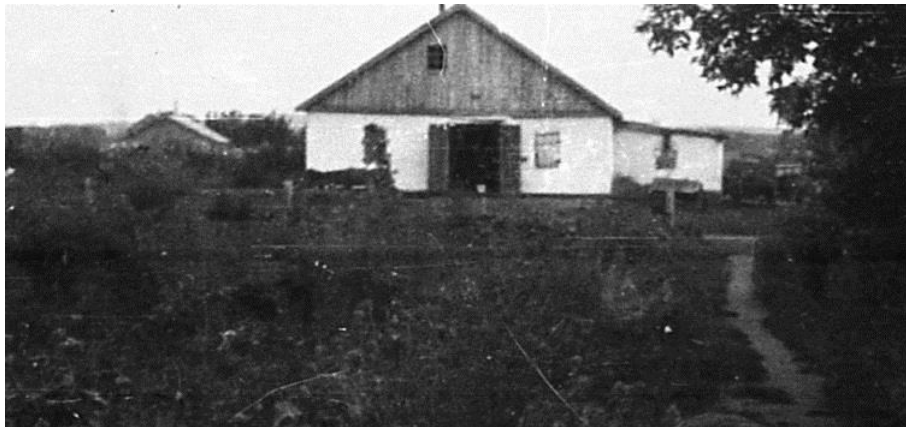
Der alte Pferdestall in der Mitte des Dorfes.

In Susanowo gab es einmal einen heftigen Windsturm. Der Wind kam von der Seite der Scheune, zog unter das Dach, hob ein Teil des Daches auf und schleuderte es über die Straßenstromleitung auf die Dorfstraße, ohne dabei die Stromleitung von beiden Seiten der Straße zu beschädigen. Leider konnte man nicht herausfinden in welchem Jahr, das geschah. Im Dorf gab es elektrischen Strom erst seit 1949. 7 Eine andere Überlieferung besagt, dass es sich um das Dach der Ölpresse gehandelt hat.