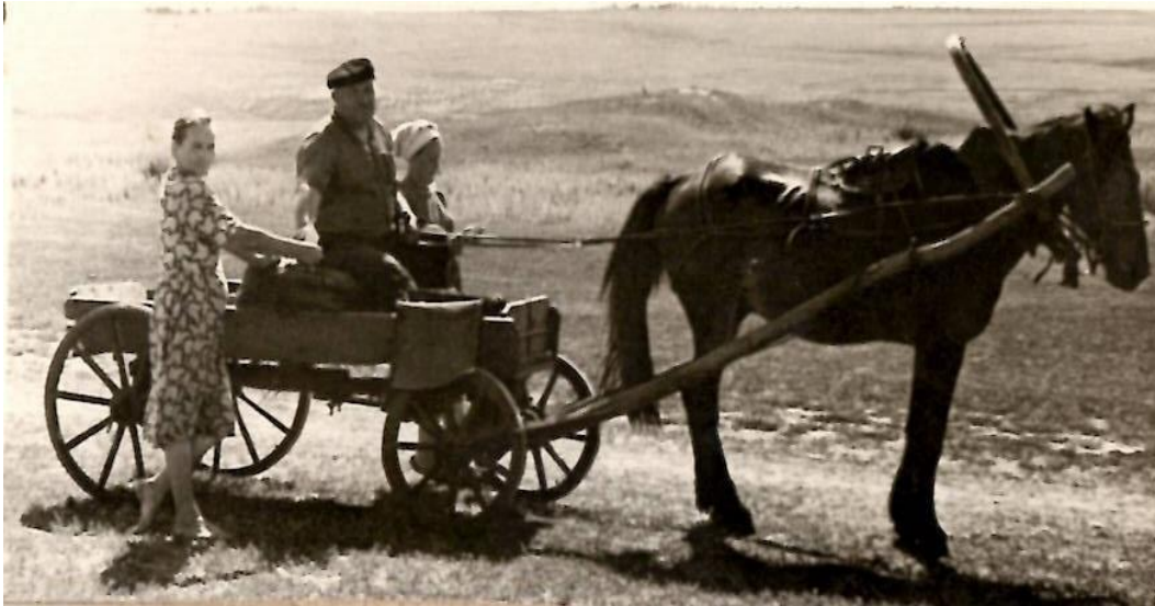
Kornelius unterwegs zu Arbeit auf der Bestarka.