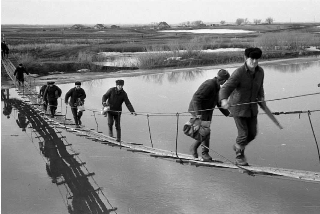
Diese Hängebrücke befand sich zwischen den Dörfern Malachowka und Ljubimowka am Fluss Koway, sie wurde auch von den Bewohnern Susanowos genutzt, wenn die Flussbrücke im Frühling während der Überschwemmung nicht passierbar war.