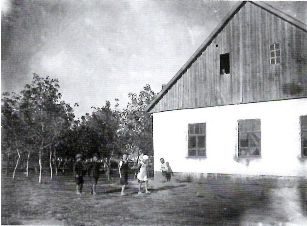
Das Schulgebäude von außen.