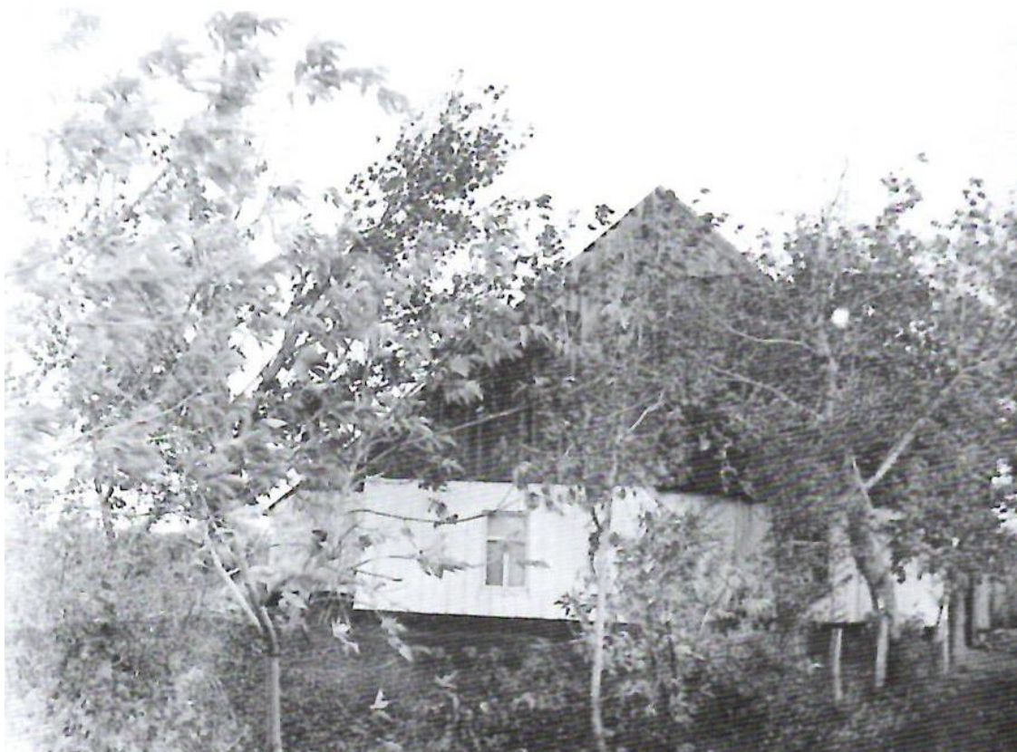
Das renovierte Haus nach dem Brand