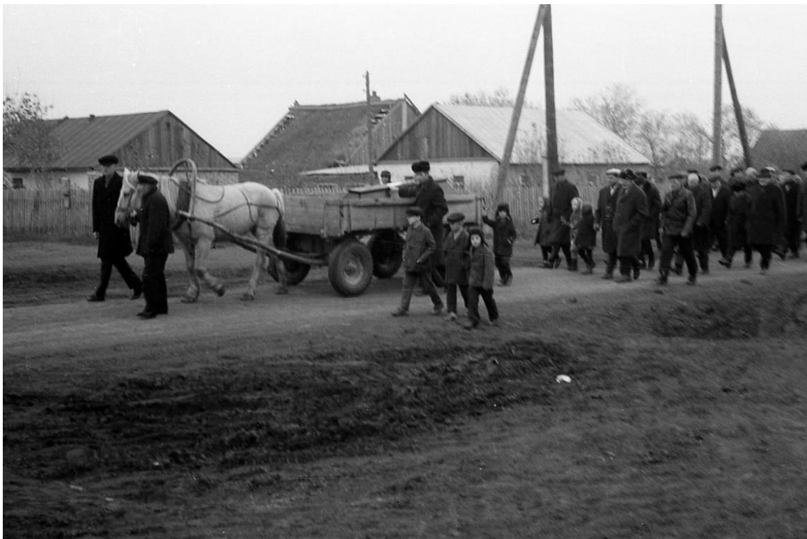
Im Hintergrund ist das alte Haus mit dem kaputten Strohdach von 1.Peter Dahl / 2.Jakob Schwarz / 3.Jakob Wiebe / 4.Peter Wiebe zu sehen