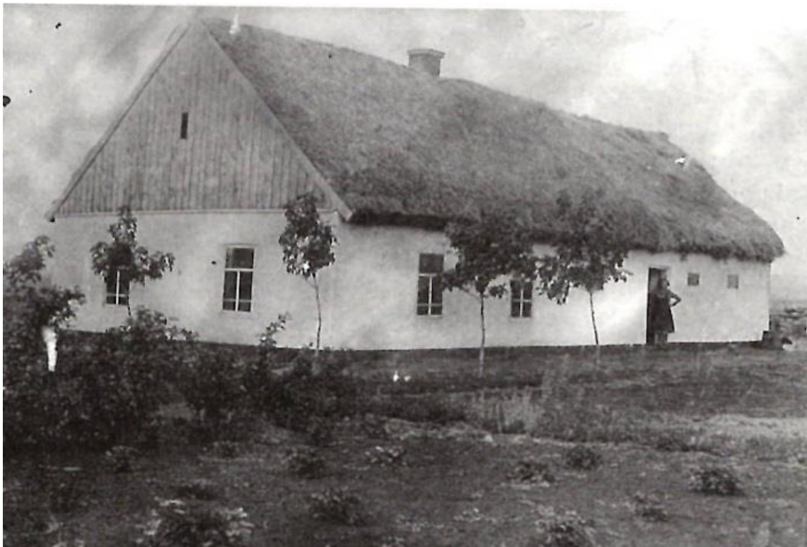
Фотография дома в Сузаново, построенного Зарой и Иваном Петерс в 1934 году.