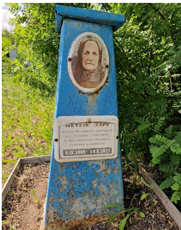
Могила Зары Петерс, урожденной Шварц, 2024, на кладбище в с. Сузаново.