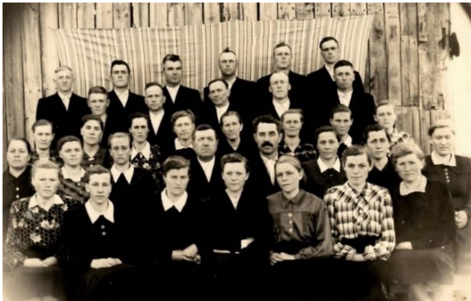
Der neu gegründete Chor der Susanower Gemeinde von 1955.