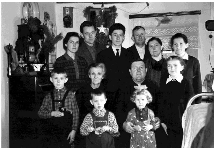
Familie Keller mit verheirateten Kindern und Enkelkindern.