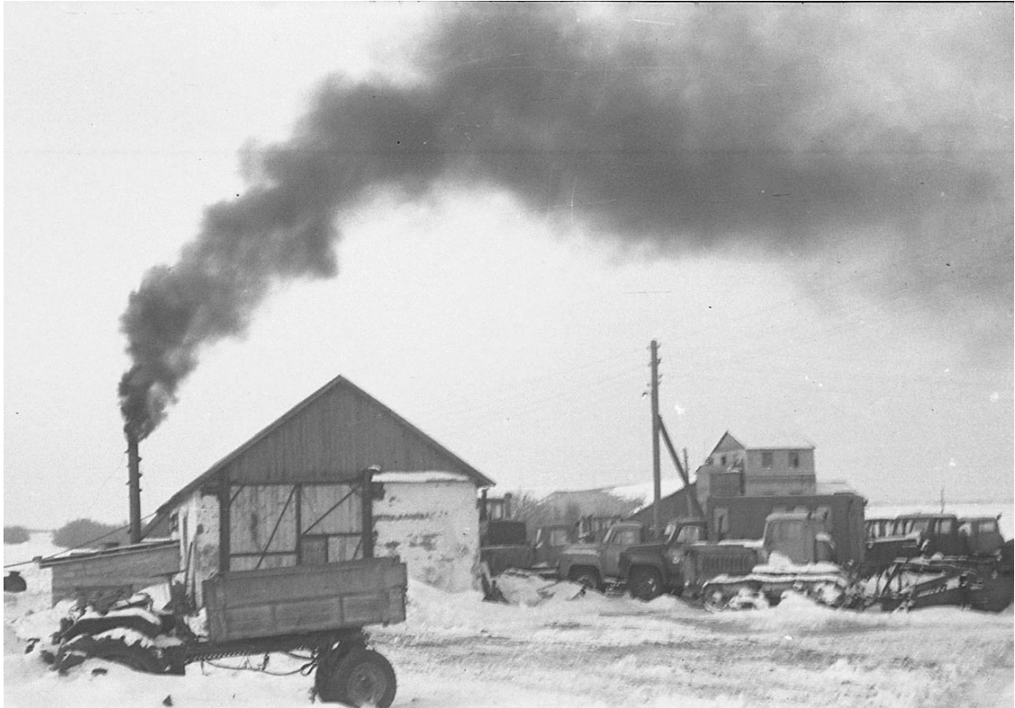
Die beheizbare Traktoren Garage.