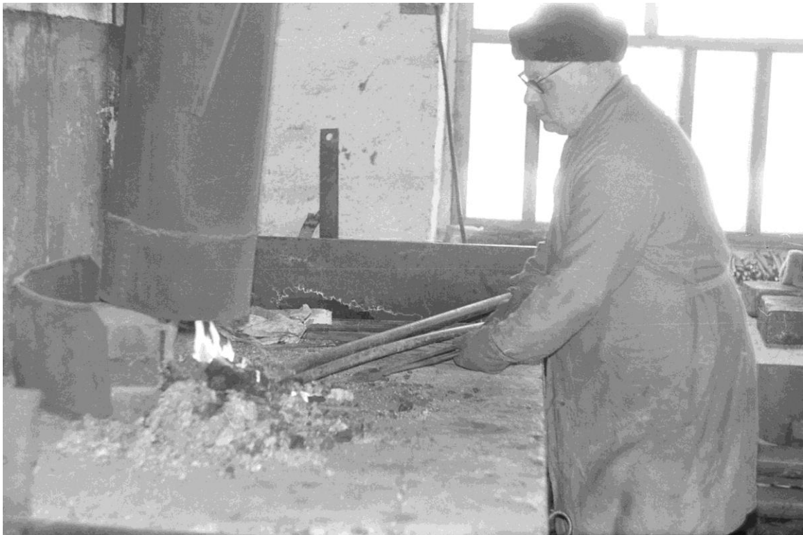
In der Schmiede.