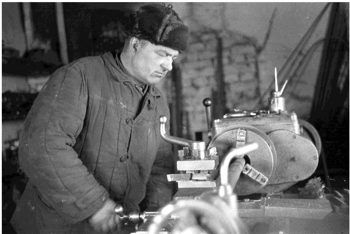
In der Metallwerkstatt.