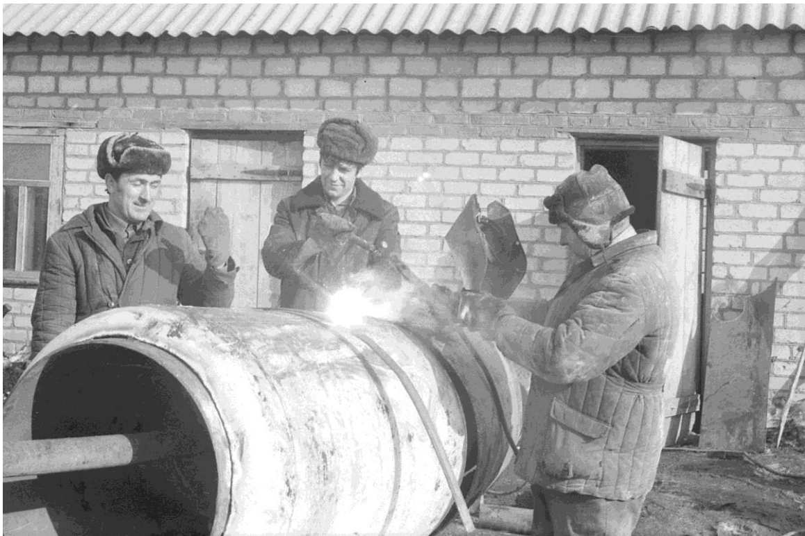
Auf dem Schmiedehof.