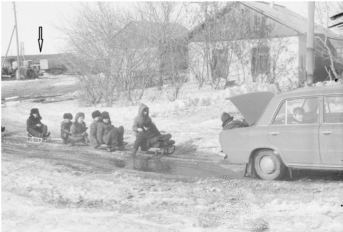
Der Pfeil zeigt auf das Ehemalige Sägewerk, gegenüber stand der Schmiedehof.