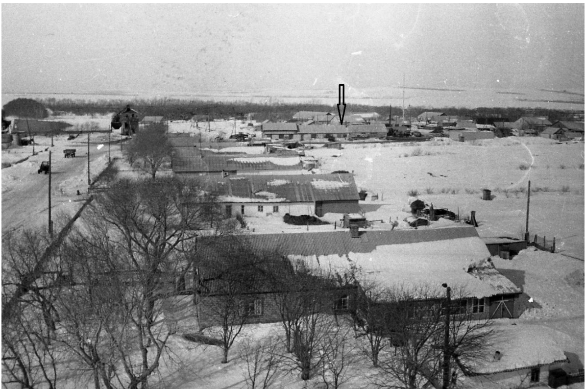
Der Pfeil zeigt auf das Schmiede-Garage-Ölpresse Gebäude.