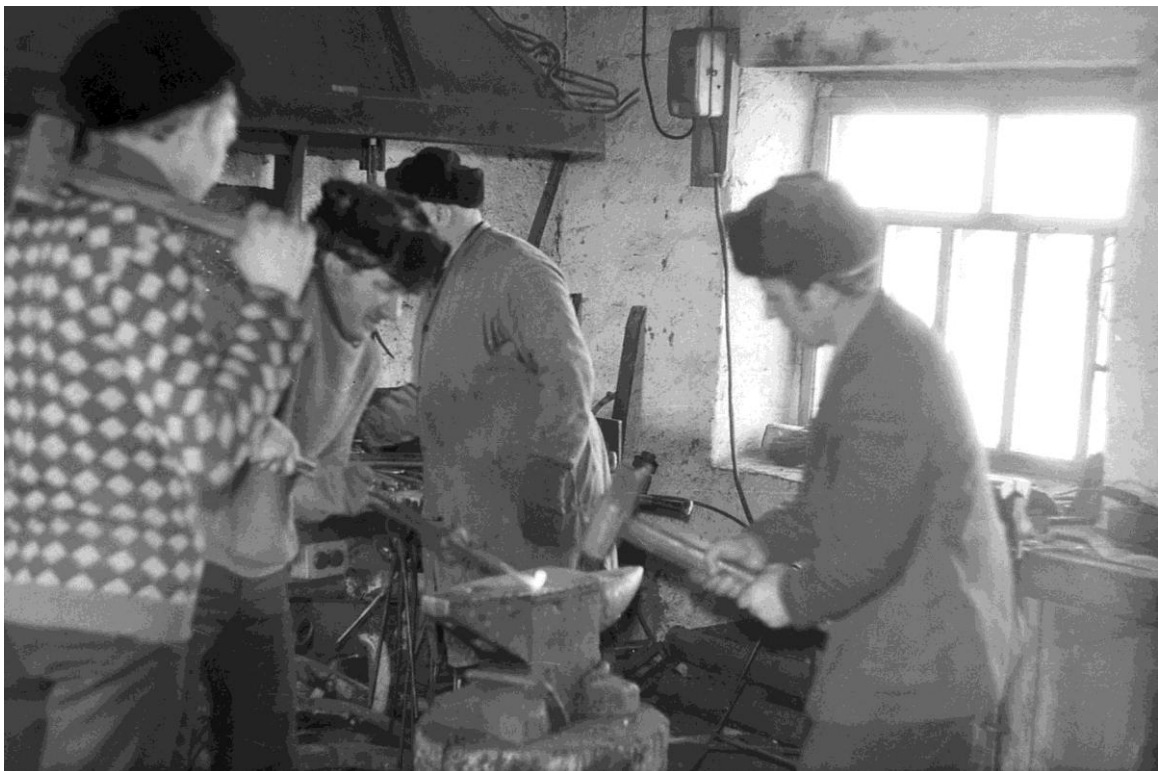
In der Schmiede.