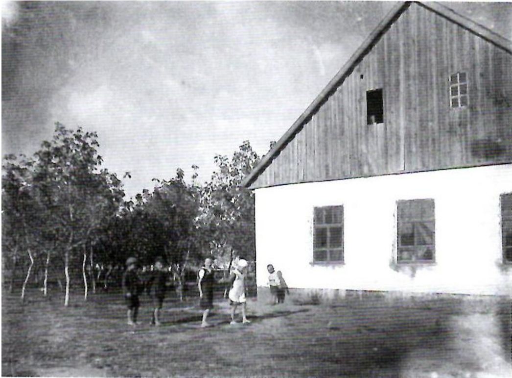
Das Schulgebäude von außen.