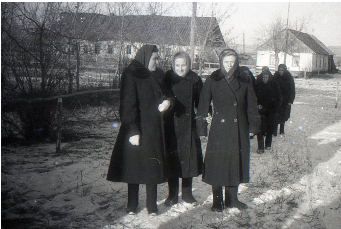
Im Hintergrund auf der linken Seite ist das langgezogene alte Petershaus zu sehen, welches zur Schule, Klub und Kindergarten umstrukturiert worden ist.