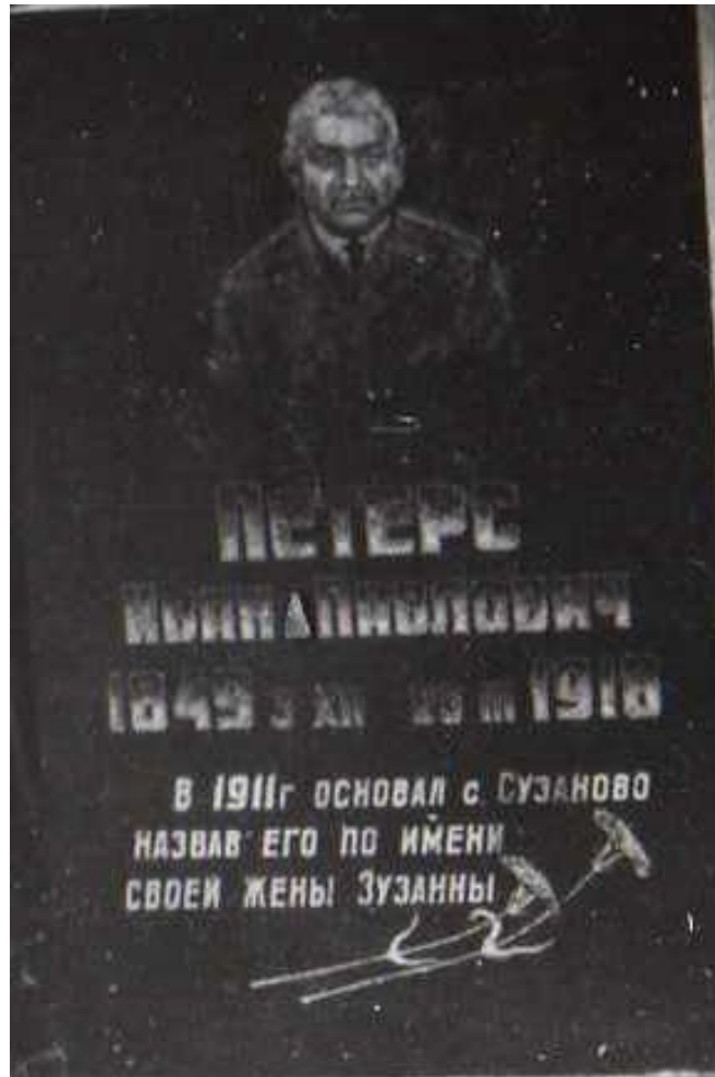
Grabstein des Dorfgründers Johann Peters